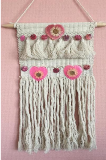
Macramee hanger versieren