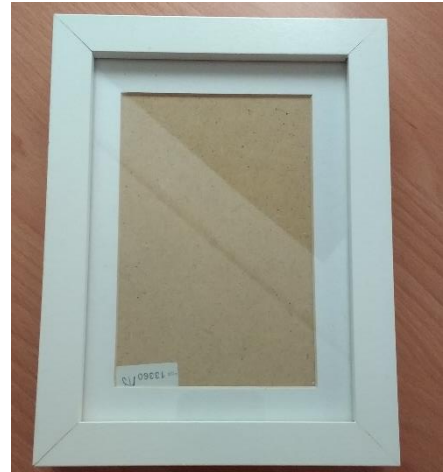
Maak je fotolijst persoonlijk